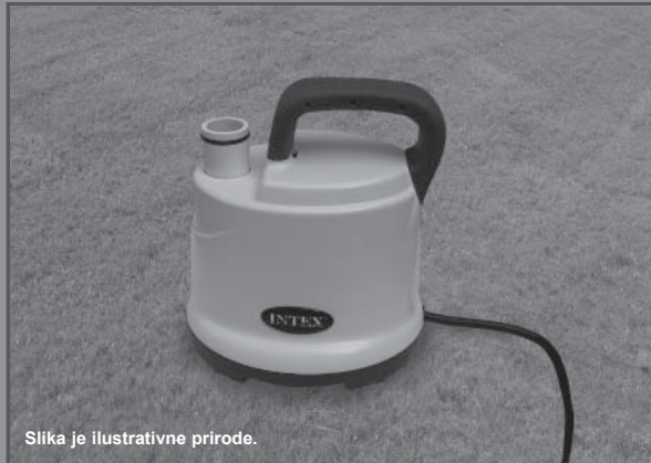
Slika je ilustrativne prirode.

Ne zaboravite da isprobate druge izuzetne proizvode Intexa: bazene, dodatke za bazene, bazene i kućne igračke na naduvavanje, krevete na naduvavanje i čamce. Potražite ih u dobro opremljenim prodavnicama ili posetite našu dole navedenu internet stranicu. Zbog politike stalnog poboljšanja proizvoda, Intex zadržava pravo izmene specifikacija i izgleda usled čega priručnik s uputstvima može biti ažuriran bez obaveštenja.